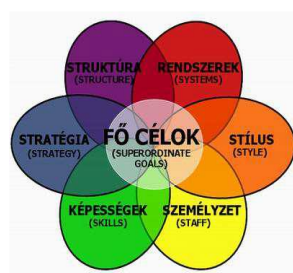
McKinsey 7 S modell alapján